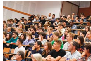
^ Participation d'étudiants à un colloque du Collège de France.